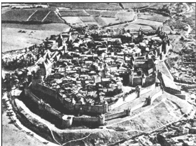
Каркассон, средневековый город. Франция

А было время, когда в городе оставались еще от стародавней поры виноградники, большие сады, даже пашни. Все это исчезло. Остатками от той поры являются два-три монастыря и рыцарский замок. Они окружены толстыми стенами с бойницами. Невольно представляешь себе, что они ждут какого-либо возмущения, внезапного нападения и всегда готовы потушить и отразить их. Лунный свет и фантастические тени сообщают им что-то живое, одушевленное. Кроме их стен, поперек города тянется постепенно обваливающаяся старая городская стена с не закрывающимися воротами: она указывает на прежнюю окружность города. Теперь город расширился, опоясался новыми, крепкими стенами, и эта старая поперечная стена стоит уныло, как памятник над могилой минувшего.