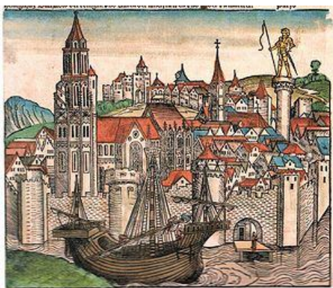
Средневековый город 13 век

Перенесемся воображением на пять столетий назад и представим себе, что мы подходим к средневековому городу в ясную, лунную ночь. Вот он обрисовался перед нами на светлом фоне неба, и кажется, что с каждым нашим шагом он надвигается на нас своими могучими стенами, своими высокими башнями. По левую сторону от нас, весело шумя, бежит извилистая река; серебряная полоса, брошенная на ее поверхность месяцем, сопутствует нам. За рекой —