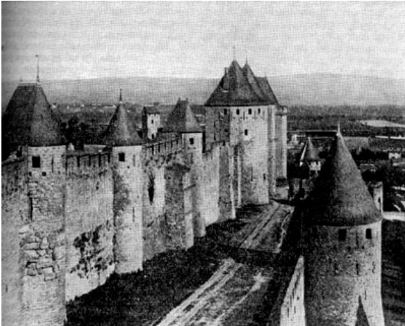
Каркассон, средневековый город. Франция

— другая, на этот раз очень высокая. На ней стоят квадратные и круглые башни с зубцами. Над воротами поднимается главная стенная башня. Эти ворота облицованы глазированными цветными кирпичами — зелеными, черными, белыми. Огромная железная решетка, которую обыкновенно спускали для преграждения входа из поперечного отверстия в своде ворот, теперь поднята, и мы свободно проникаем за крепкие городские стены.