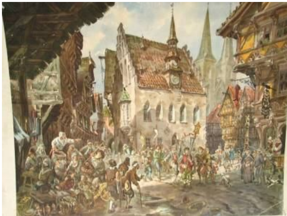
Средневековый город 13 век

Всмотревшись хоть немного в двигающуюся по улицам толпу, мы сейчас же заметим, что почти все движется в одном направлении, а именно — к городской площади. Последуем за ними. На ратуше выкинут красный флаг. Торг открыт. Сюда приезжают в повозках, верхом, но пешеходы решительно преобладают.