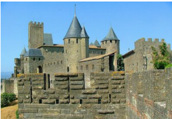
Каркассон, средневековый город. Франция

— другая, на этот раз очень высокая. На ней стоят квадратные и круглые башни с зубцами. Над воротами поднимается главная стенная башня. Эти ворота облицованы глазированными цветными кирпичами — зелеными, черными, белыми. Огромная железная решетка, которую обыкновенно спускали для преграждения входа из поперечного отверстия в своде ворот, теперь поднята, и мы свободно проникаем за крепкие городские стены.